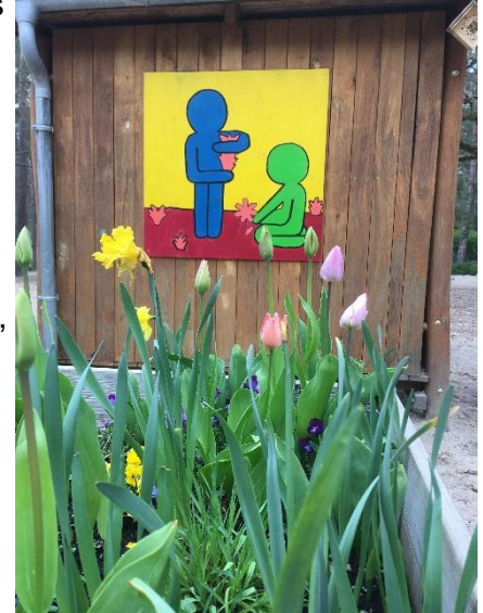
Ein Frühlingsgruß - Hochbeet